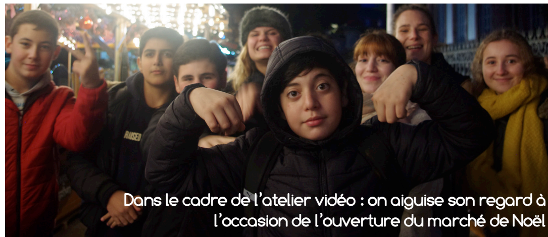
Dans le cadre de l'atelier vidéo : on aiguise son regard à l'occasion de l'ouverture du marché de Noël

Le président et les présidents de section, de chambre ou de formation de jugement peuvent, par ordonnance, régler les affaires dont la nature ne justifie pas l'intervention de l'une des formations prévues à l'article L. 731-2. Un décret en Conseil d'Etat fixe les conditions d'application du présent article. Il précise les conditions dans lesquelles le président et les présidents de section, de chambre ou de formation de jugement peuvent, après instruction, statuer par ordonnance sur les demandes qui ne présentent aucun élément sérieux susceptible de remettre en cause la décision d'irrecevabilité ou de rejet du directeur général de l'office.