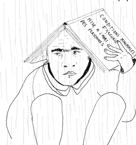
La maison de papier